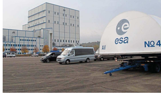
Les Mureaux. Le site Ariane Group développe et produit le premier étage de la fusée Ariane 5. En parallèle, il développe le lanceur européen Ariane 6 avant de pouvoir produire prochainement le premier étage.

Pour l'occasion, les festivités et conférences scientifiques vont se succéder tout au long de l'année. Cela commence aujourd'hui : l'orchestre de la Musique de l'air, la formation de 55 musiciens de l'armée de l'air*, va