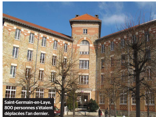
Saint-Germain-en-Laye. 800 personnes s'étaient déplacées l'an dernier.

■ Demain, au 5, rue Pasteur. De 10 heures à 17 heures.